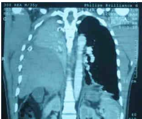
Figure 2. Scanner thoracique (coupe coronale) : passage du foie dans l'hémi-thorax droit à la hauteur du tronc de l'artère pulmonaire avec un poumon droit collabé et non aéré.