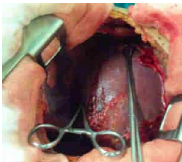
Figure 4. Vue per-opératoire par thoracotomie postéro-latérale droite : passage total et isolé du foie en intra-thoracique à travers une brèche de 15cm sur le grand axe de la coupole droite.

Le patient était opéré par une voie d'abord thoracique postéro-latérale droite, avec découverte d'un passage total et isolé du foie en intra-thoracique à travers une brèche de 15cm sur le grand axe de la coupole droite (Figure 4). Le pédicule hépatique était étiré sans rupture décelable. L'intervention consistait en une libération soigneuse des adhérences et en une réintégration du foie en intra-abdominal avec suture de la plaie diaphragmatique par des points séparés au fil résorbable. Les suites opératoires en réanimation étaient marquées essentiellement par un réveil calme après 48H de sédation permettant l'extubation sans incident respiratoire particulier et par l'ablation des deux drains thoraciques successivement à J4 et J7 postopératoire.