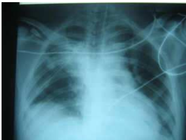
Figure 1. Radiographie thoracique : opacité de l'hémi-champ pulmonaire droit effaçant la coupole diaphragmatique homolatérale, drain thoracique en place.