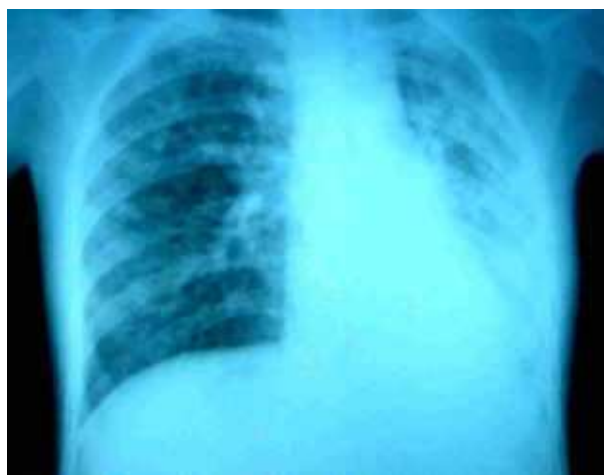
Figure 1 : Opacités pulmonaires ouatées et micronodulaires bilatérales et syndrome cavitare parahilaire droit

A l'admission à l'hôpital, elle a présenté un syndrome psychiatrique sous forme de confusion mentale mais elle n'a pas encore présenté de fièvre. Dans la littérature, la méningite tuberculeuse n'entraîne une fièvre supérieure à 39°C que dans moins de 20 % des cas [2,3]. Selon Korinek [4], habituellement, la méningite tuberculeuse réalise plutôt un tableau subaigu, évoluant sur plusieurs jours, avec altération progressive de l'état général, fièvre au long cours et un syndrome méningé peu marqué. Il est essentiel de rechercher une notion de contact récent ou d'immigration, de vérifier le statut vaccinale vis-à-vis de la tuberculose, de rechercher d'autres signes d'appel pulmonaire ou extrapulmonaire (pulmonaire, choroïdienne) de la tuberculose pour orienter le diagnostic [5]. Comme notre patiente était une ancienne élève infirmière, un éventuel contact avec de malade de tuberculose au cours de son stage hospitalier n'est pas à éliminer.